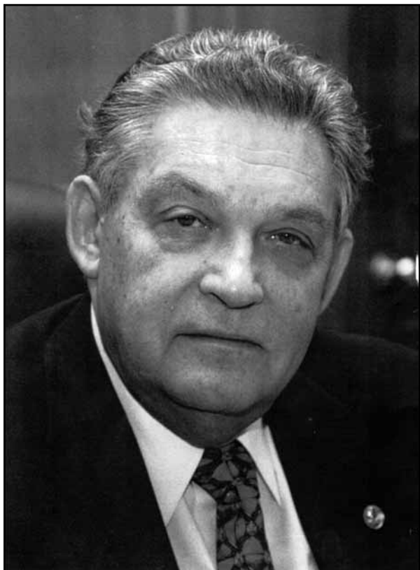
Олег Емельянович КУТАФИН